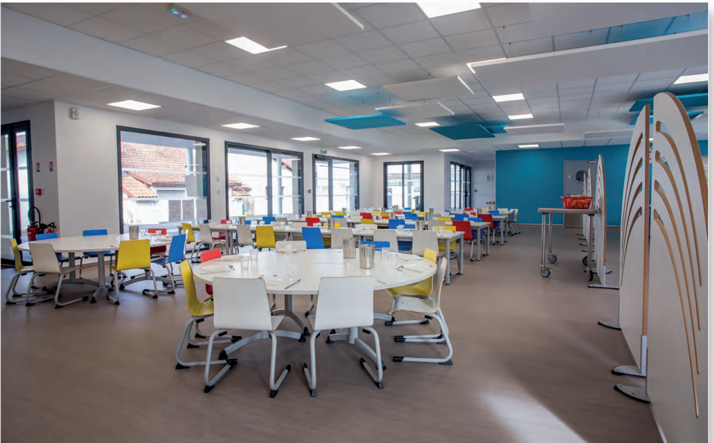
Le restaurant scolaire